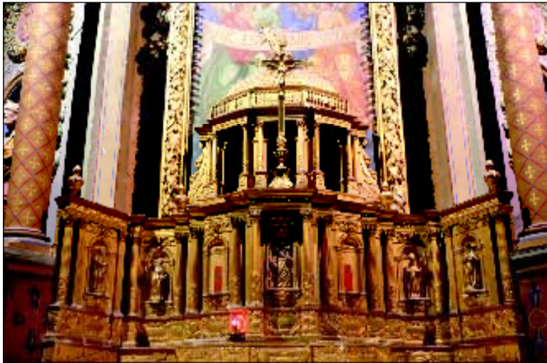
Le grand tabernacle de bois doré de l'église Saint-Martin de Ligueil a été classé au titre des monuments historiques le 12 mars 1907.

PATRIMOINE Dans le cadre d'un projet d'étude baptisé « Agissons pour le plus grand musée de France », une jeune étudiante de 25 ans veut mettre en lumière les églises de Ligueil et de Vou, qui recèlent bien des richesses.