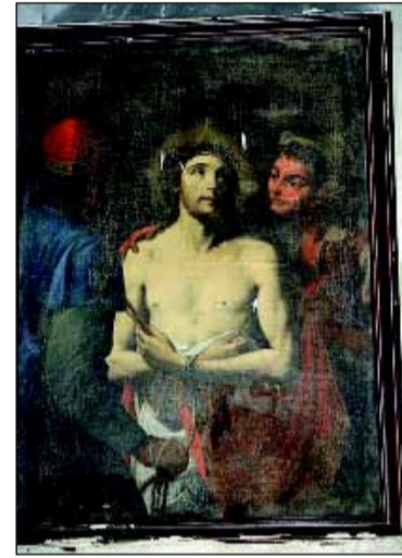
En l'église Saint-Pierres-Liens, de Vou, la peinture représentant le Christ aux outrages.