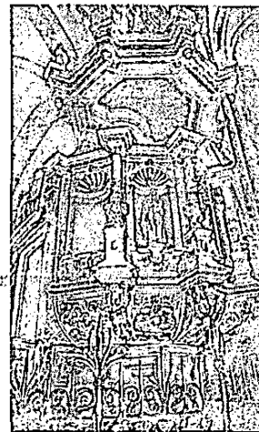
La chaire en grès de Sélestat.